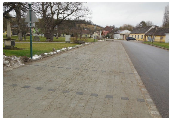
Fertigstellung Dorfplatz Hagenberg