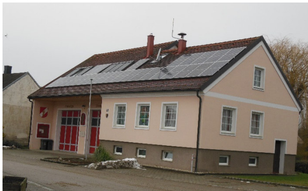
Photovoltaikanlage am FF Haus Hagenberg