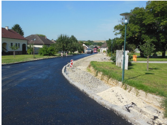
Asphaltierungsarbeiten L10 Hagenberg